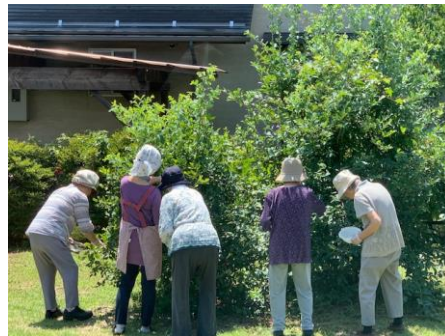
ブルーベリー摘み