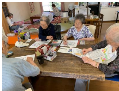
カレンダーの色塗り