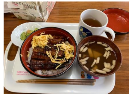
うな井を食べました