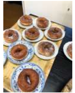
おやつのだーナツ