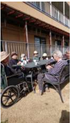
庭でティータイム