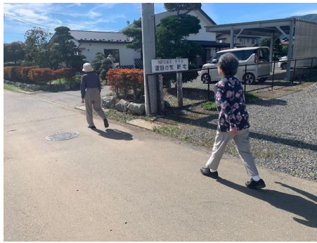
生け垣が色づいてきました