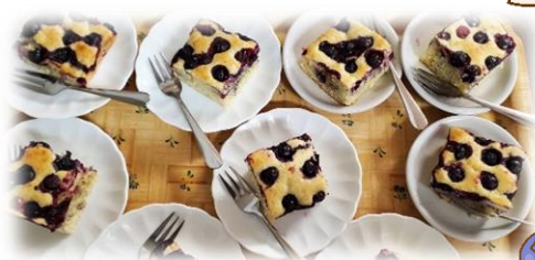
庭で採れたブルーベリーでおやつ