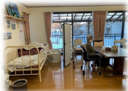
新宅 陰性だった方は ホールで過ごしました