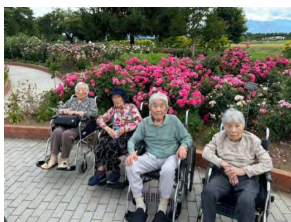
スカイパークにバラを見に行ってきました