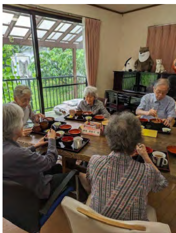
昼食にうなぎをいただきました