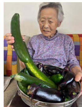
畑で採れた大きいきゅうり