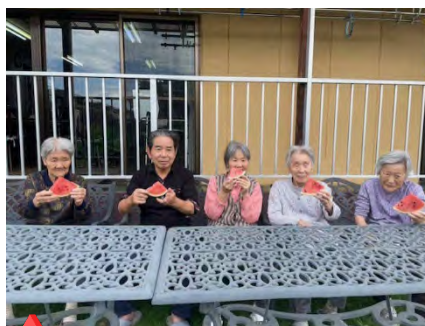
外でスイカを食べました