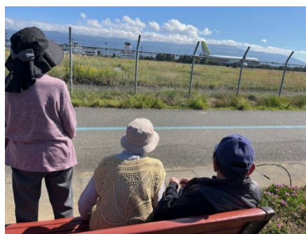
飛行機を見ました